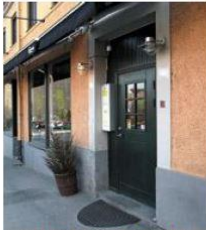
Världens Bar, Västgötegatan 15