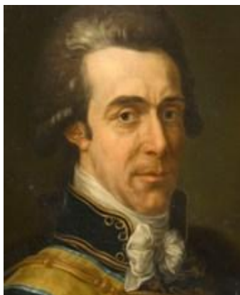
Axel von Fersen