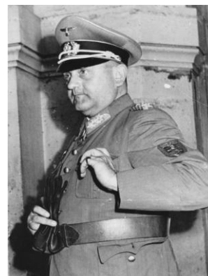
Le général Dietrich von Choltitz