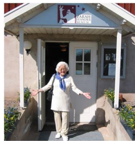
Zarah Leandermuseet i Häradsхамmar

12h00 Déjeuner au restaurant qui est près du château.