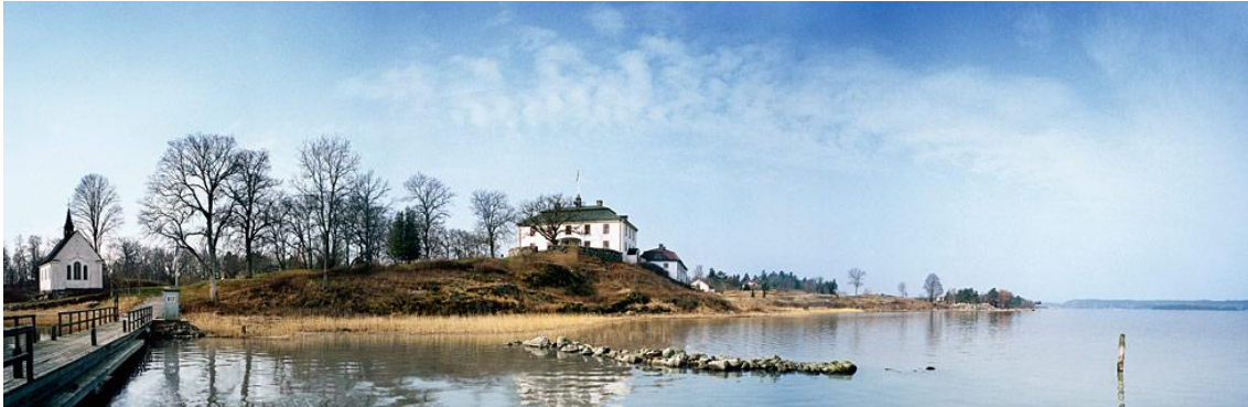
Château de Mauritzberg