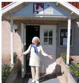
Zarah Leandermuseet i Häradshammar