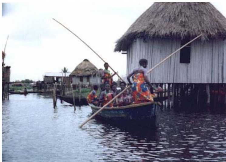
Ganvié, Venise de l'Afrique, site le plus connu du Bénin